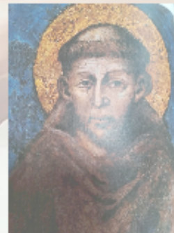
Franz von Assisi