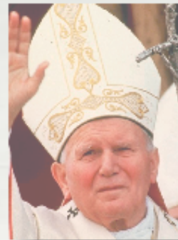
Johannes Paul II