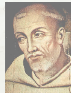
Bernhard von Clairvaux